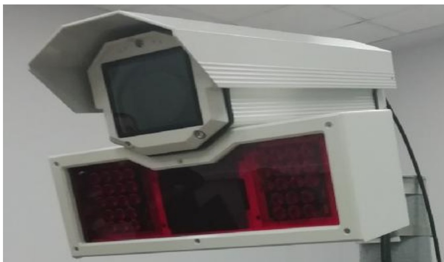
Рисунок 2. Общий вид фоторадарного блока

Общий вид фоторадарного блока представлен на рисунке 2.