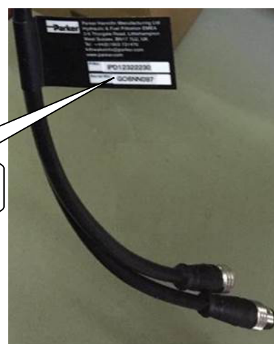
Рисунок 10 – Место нанесения заводского номера модификации IcountPD