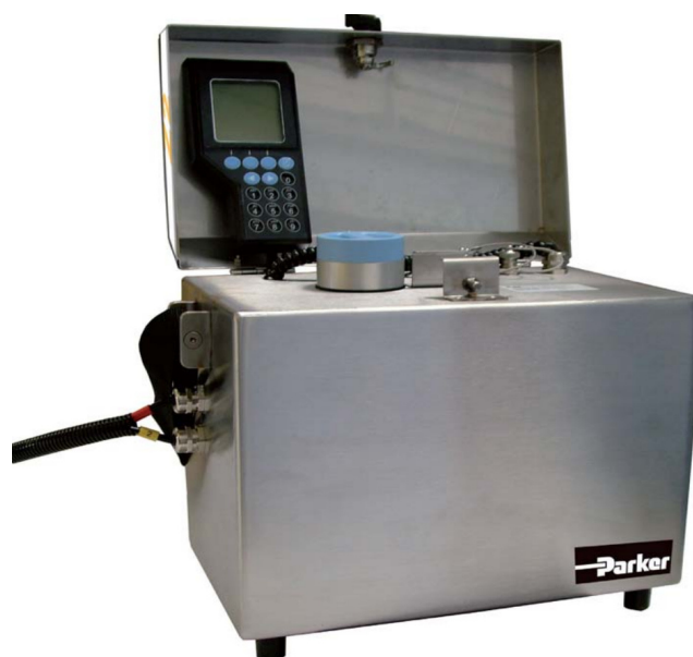
Рисунок 3 – Общий вид счетчика модификации ACM20 Z2