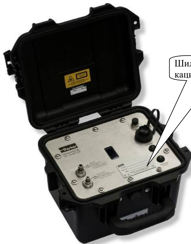
Рисунок 5 – Общий вид счетчика модификации iCountPD с указанием