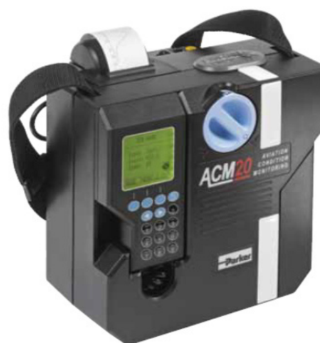
Рисунок 2 – – Общий вид счетчика модификации ACM20