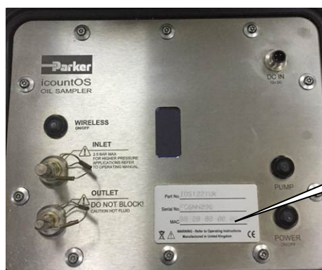
Рисунок 11 – Место нанесения заводского номера модификации icountOS