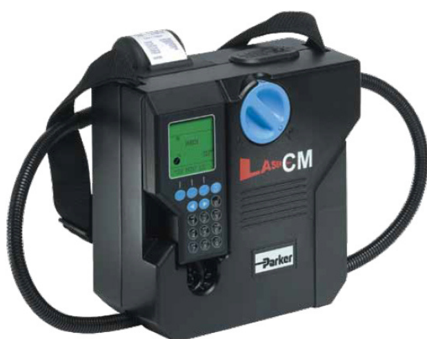
Рисунок 1 – Общий вид счетчика модификаций LaserCM20

Нанесение знаков утверждения типа и поверки непосредственно на счетчики не предусмотрено.