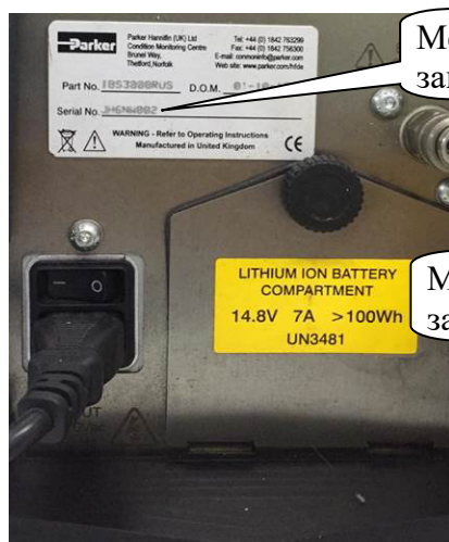
Рисунок 9 – Место нанесения заводского номера модификаций icountBS и icountBS2