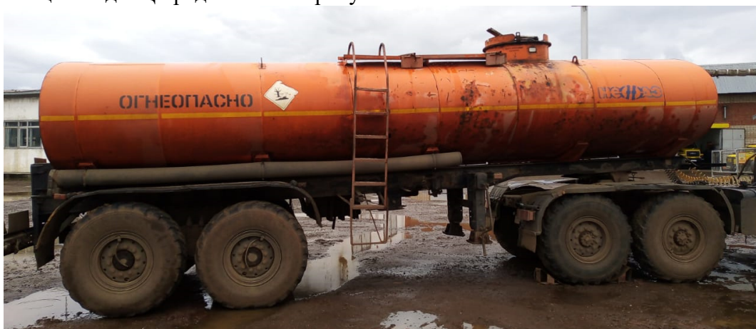
Рисунок 1 – Общий вид АЦ.