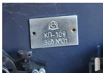
Рисунок 2 – Заводской номер интерферометра