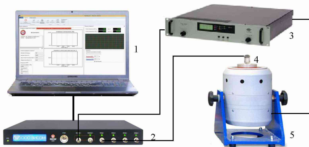
1 – ПЭВМ; 2 – ВС-301; 3 – усилитель мощности; 4 – вибропреобразователь AP10; 5 – вибростенд

7.8.1 Собрать схему, приведенную на рисунке 1. Выход вибропреобразователя AP-10 подключить на 1 вход ВС-301.