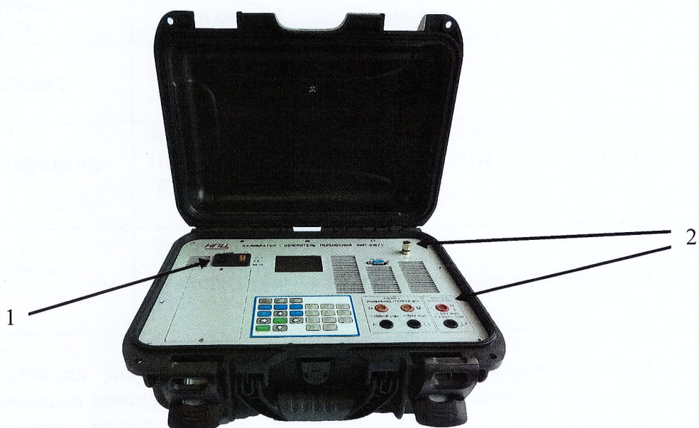
Рисунок 1 - Внешний вид калибратора КИП-01В