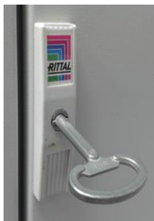
Рисунок 3 - Вид внешний замка и ключа шкафа кроссировочного