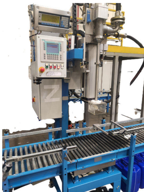
Рисунок 1 – Общий вид средства измерений