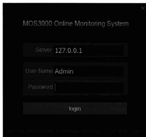
Рисунок 1 – Вход в систему

9.2 В появившемся окне (рисунок 1) необходимо ввести IP-адрес сервера (по умолчанию) «127.0.0.1», имя пользователя - «Admin». В случае, если владелец системы снял пароль, поле «Password» остается пустым.