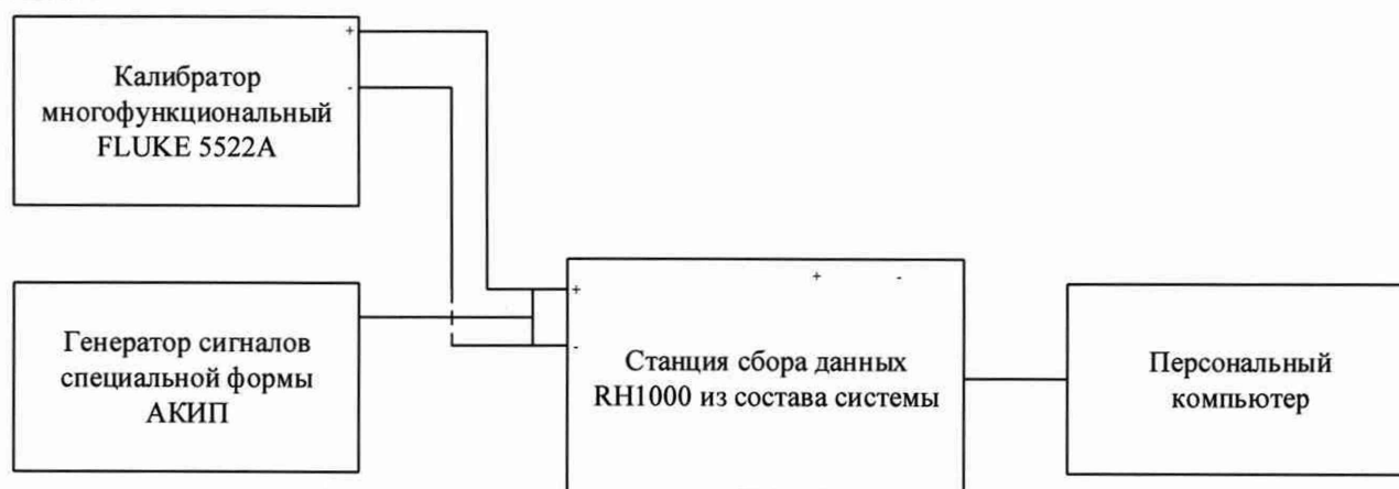
Рисунок 3 – Схема подключения средств измерений к системе при поверке ИК вибрации

10.1.1 Перед определением относительной погрешности преобразований входных сигналов в значения виброускорения к системе подключают эталонные средства измерений в соответствии с рисунком 3.