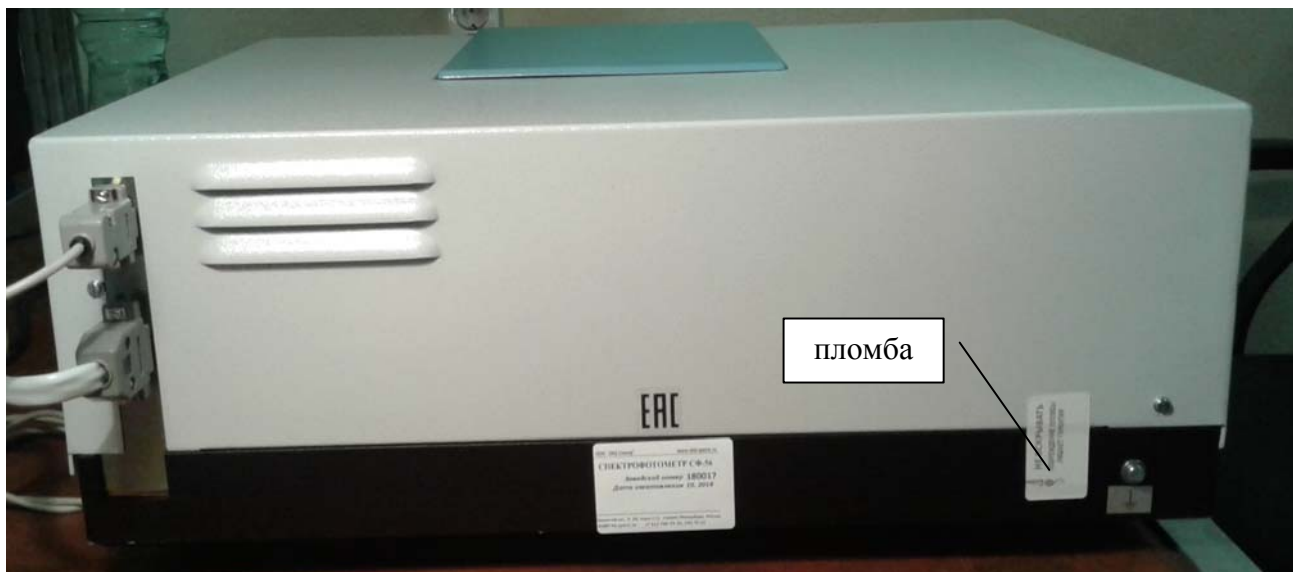
Рисунок 2 – Схема пломбировки спектрофотометра