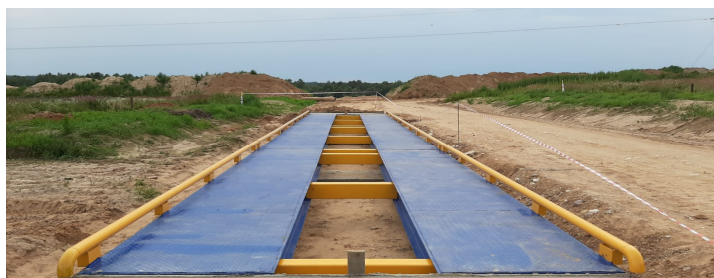
Рисунок 1 - Общий вид ГПУ весов

Общий вид ГПУ весов представлен на рисунке 1.