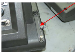
Весы с индикатором МИ ВДА/12Я

Места ограничения доступа к местам настройки (регулировки) представлены на рисунке 4. Способ ограничения доступа к местам настройки (регулировки) – пломба с нанесением знака поверки.