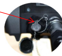
Весы с индикатором ТИТАН 12