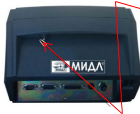
Весы с индикатором МИ ВДА/6Я, МИ ВДА/7Я