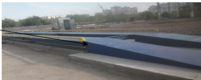
Рисунок 2 - Место нанесения знака утверждения типа на боковую сторону ГПУ весов

Общий вид применяемых индикаторов представлен на рисунке 3.