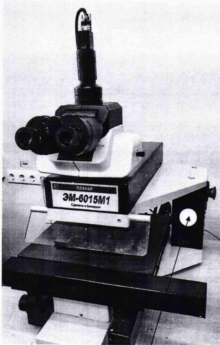
Схема (рисунок) с указанием места для нанесения знака поверки средств измерений