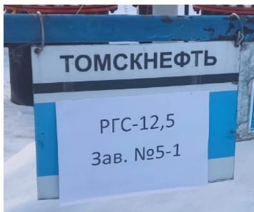
Рисунок 3 – Общий вид маркировочной таблички резервуара стального горизонтального цилиндрического РГС-12,5