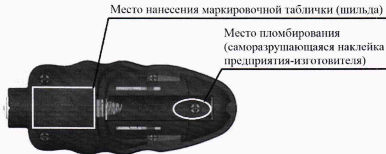
Рисунок А.1 – Схема пломбировки от несанкционированного доступа