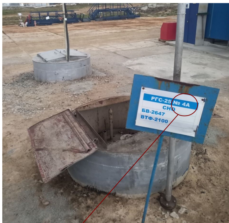
Место нанесения заводского номера