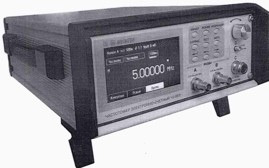
Рисунок 1.1 – Частотомер электронно-счетный ЧЗ-96/2. Внешний вид

Фотографии общего внешнего вида средства измерений