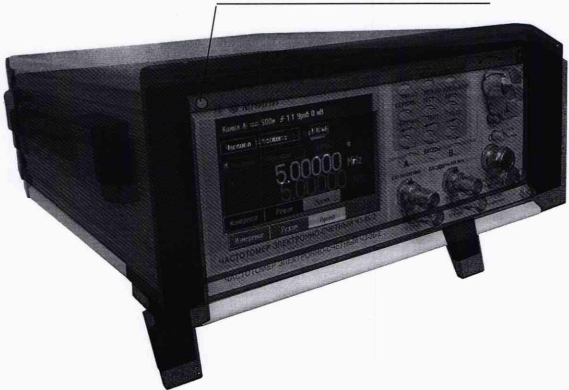
Рисунок 2.1 – Частотомер электронно-счетный ЧЗ-96/2.

Место нанесения знака поверки (клейма-наклейки) Рисунок 1.1 – Частотомер электронно-счетный ЧЗ-96/2. Внешний вид