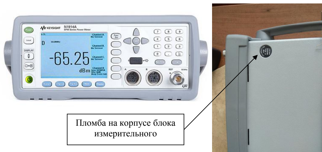
Рисунок 1 – Общий вид блока измерительного N1914A