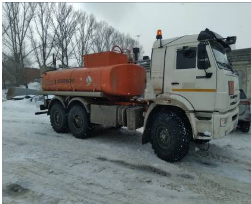
Рисунок 1 – Общий вид автоцистерны 6619Н-19