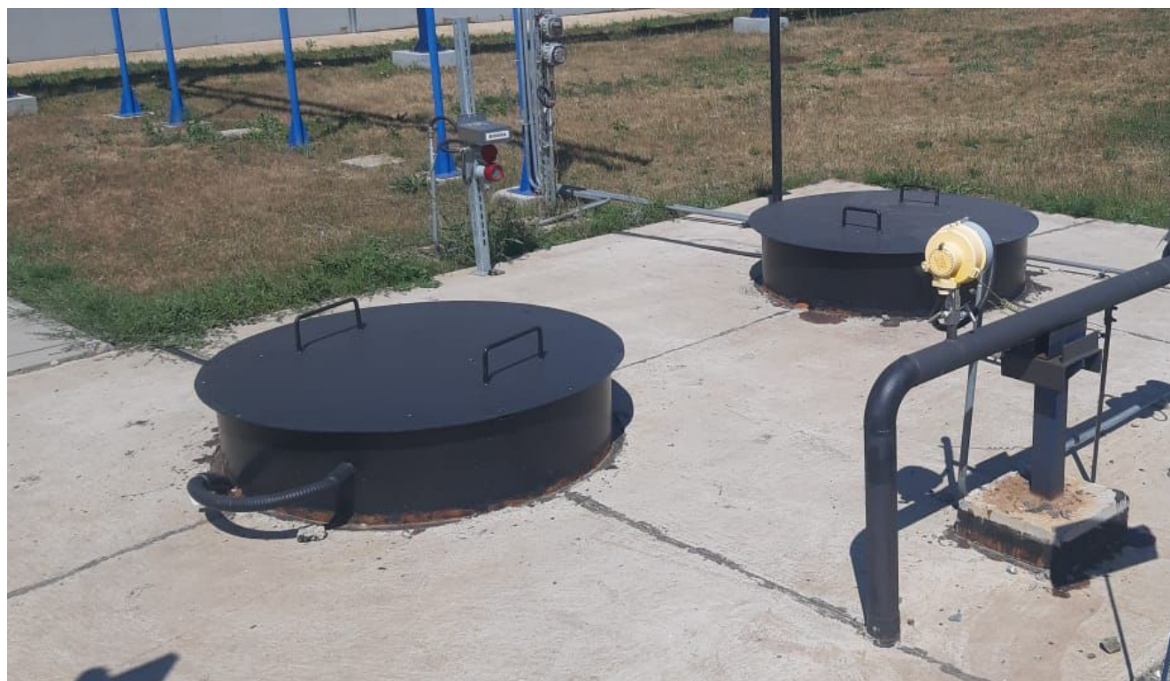
Рисунок 2 – Общий вид резервуара РГСП-50