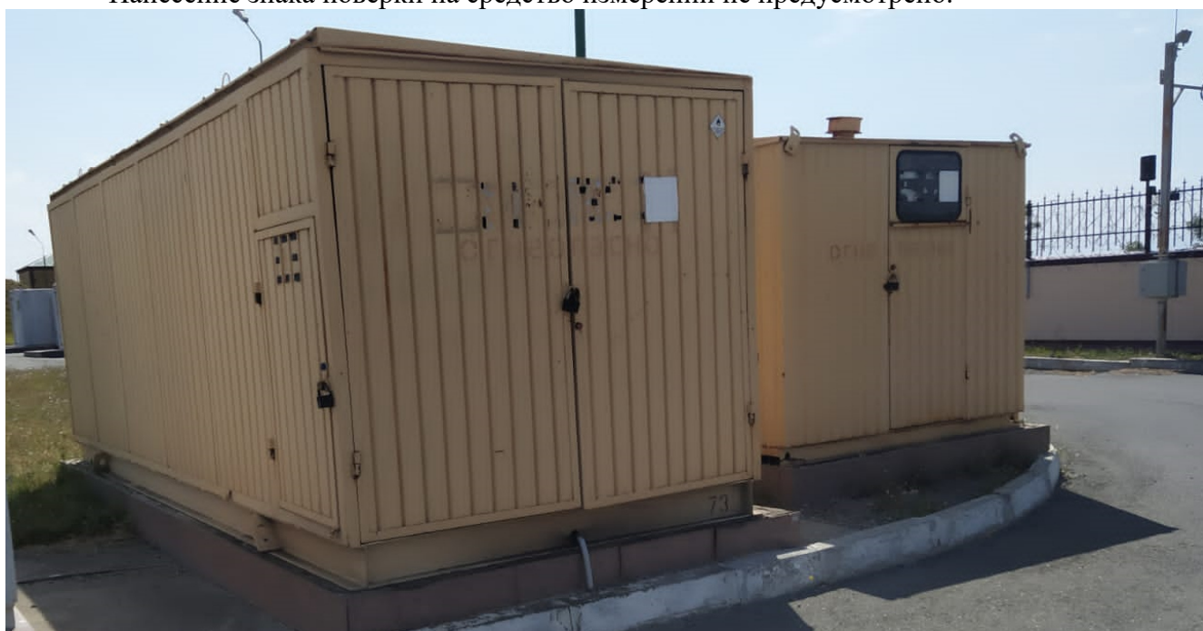
Рисунок 1 – Место расположения резервуаров РГС-5 с заводскими номерами 69/1, 69/2

Нанесение знака поверки на средство измерений не предусмотрено.