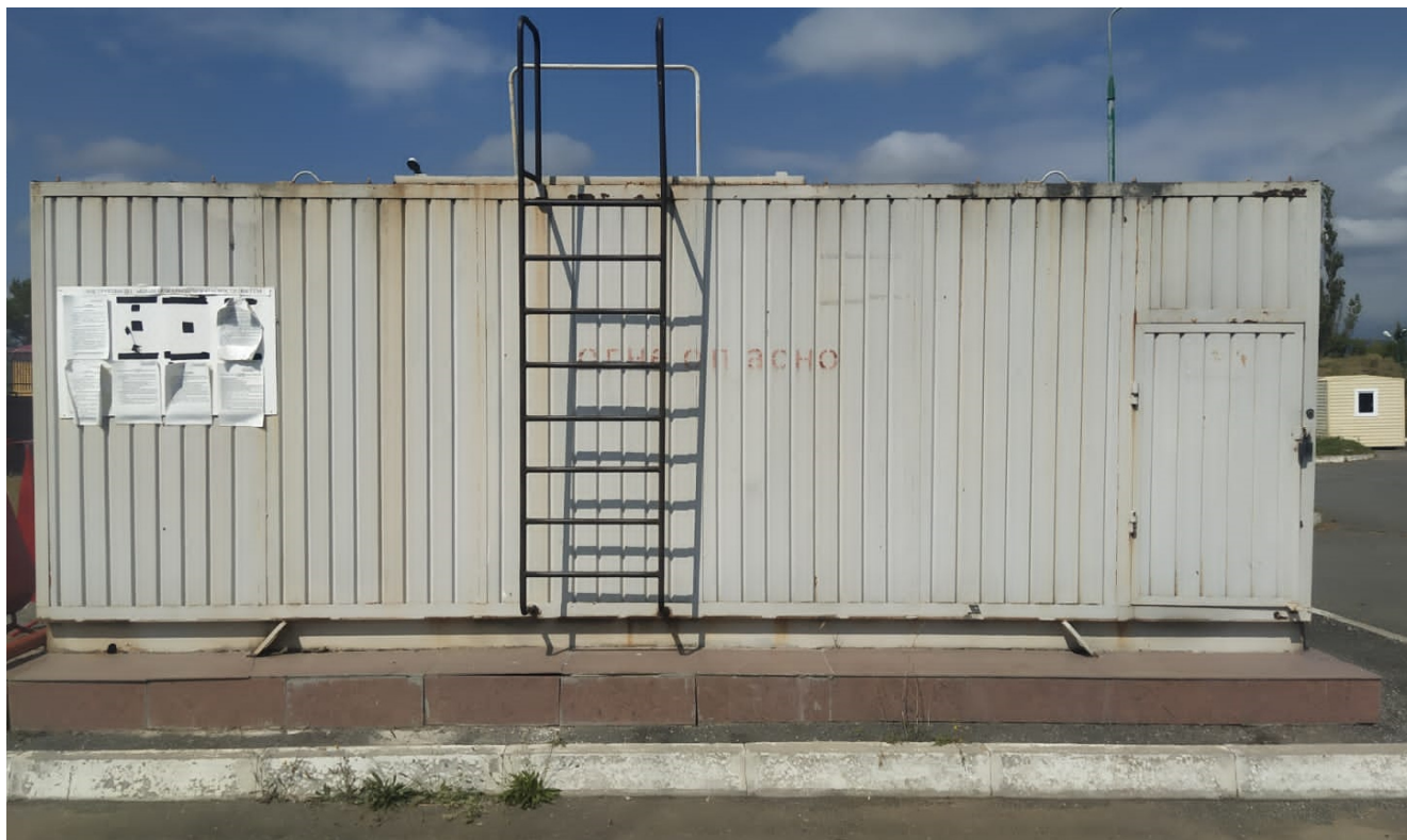
Рисунок 2 – Место расположения резервуаров РГС-5 с заводскими номерами 79/1, 79/2