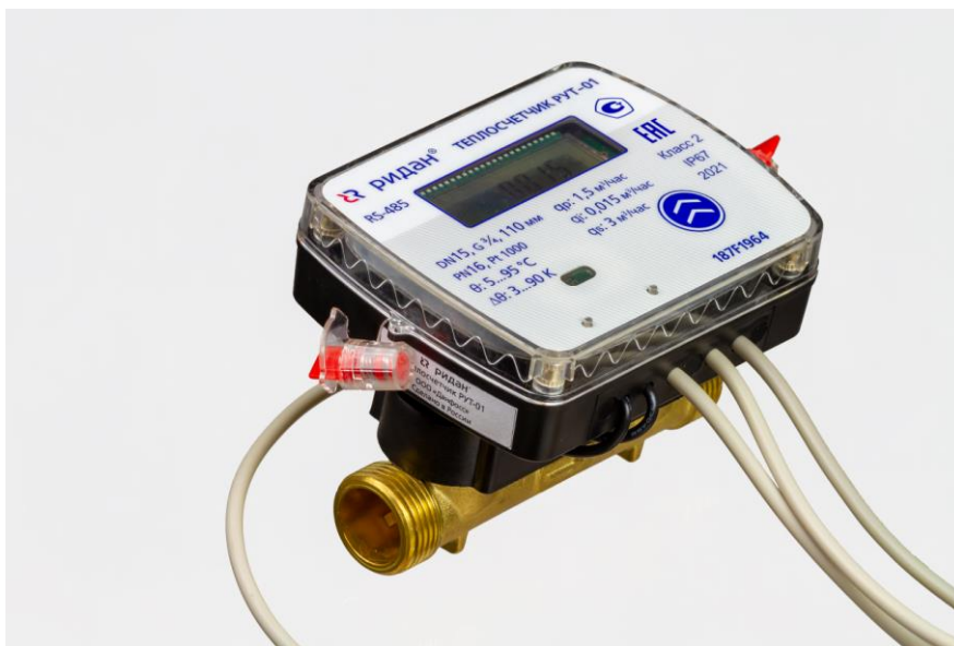
Рисунок 1 – Общий вид теплосчетчиков РУТ-01

Схема пломбировки от несанкционированного доступа представлена на рисунке 2.