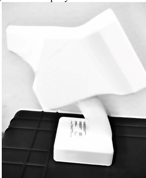
Рисунок 1 – Общий вид спектрометра

Общий вид спектрометров представлен на рисунке 1. Место нанесения заводского номера на спектрометры представлено на рисунке 2.