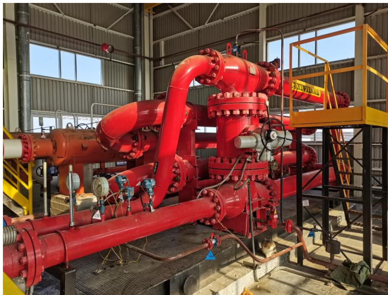
Рисунок 1 – Общий вид ТПУ

Установка пломб на ТПУ осуществляется с помощью контрольной проволоки и свинцовой (пластмассовой) пломбы с нанесением знака поверки давлением на пломбы, установленные: