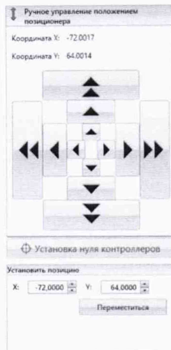
Рисунок 2 – Меню программы для ручного управления движением сканера

Перемещая антенну-зонд с установленным оптическим отражателем вдоль осей Ox и Oz (горизонтальная плоскость сканирования) в пределах рабочей зоны сканера с шагом \lambda_{min}/2 (где \lambda_{min} - минимальная длина волны, соответствующая верхней границе диапазона рабочих частот комплекса, до срабатывания механического ограничителя), фиксировать показания системы Leica Absolute Tracker AT401.