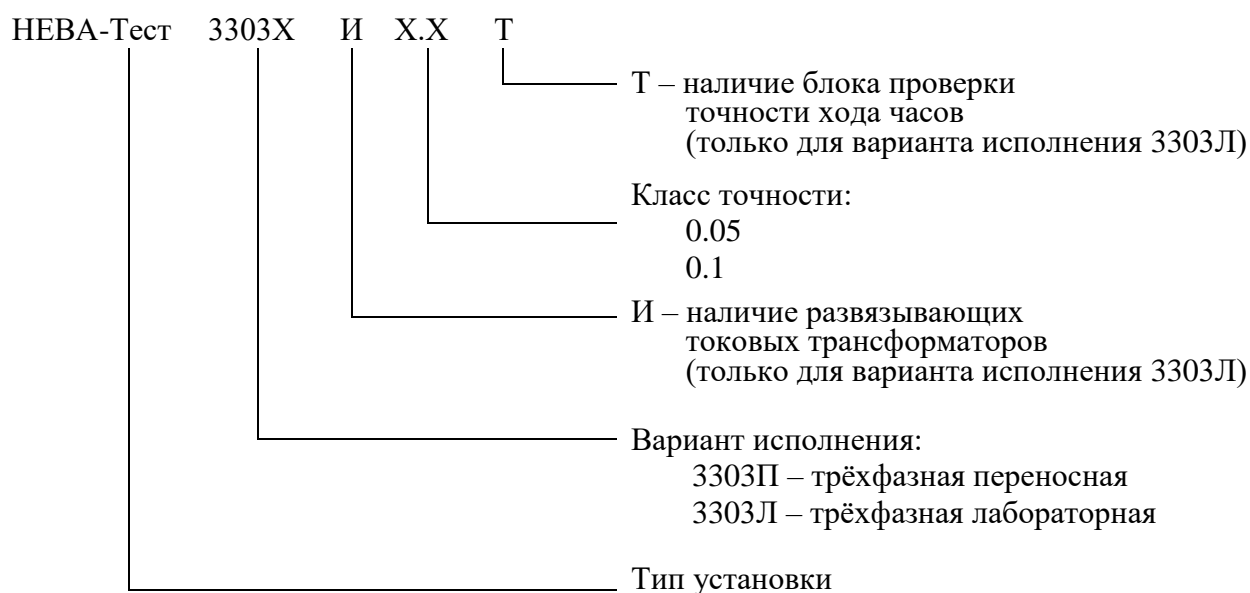
Рисунок 1 - Структура обозначений исполнений установок

Структура обозначений исполнений установок приведена на рисунке 1.