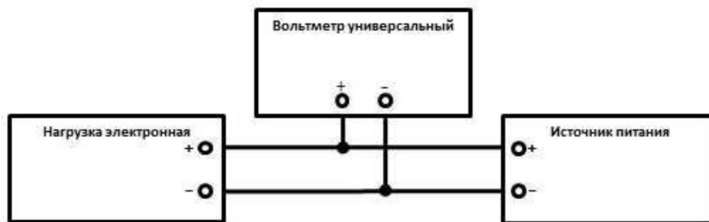
Рисунок 1 – Схема подключения приборов при определении погрешности установки и измерения напряжения

10.1.2 На поверяемой нагрузке выбрать режим стабилизации напряжения. Выбрать нижний диапазон установки и измерения напряжения.