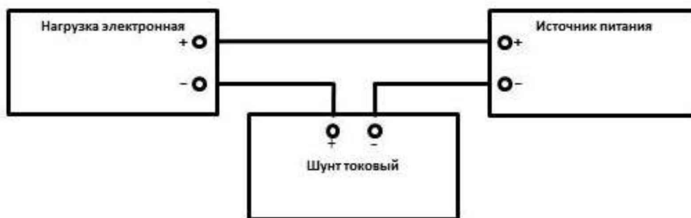
Рисунок 2 – Схема подключения приборов при определении погрешности установки и измерения силы тока

10.2.1 Собрать схему в соответствии с рисунком 2.