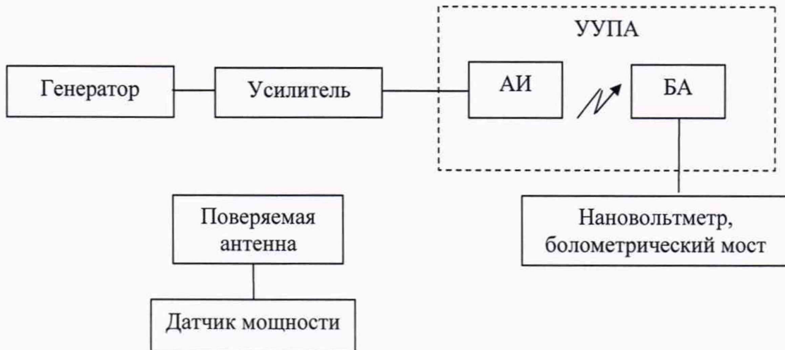
Схема измерений приведена на рисунке 1.

9.2.1 Погрешность коэффициента калибровки антенн, входящих в состав комплекта EMCO 3121D, определяют методом замещения поверяемой антенны эталонной антенной БА из состава установки УЭПЭ-БА.