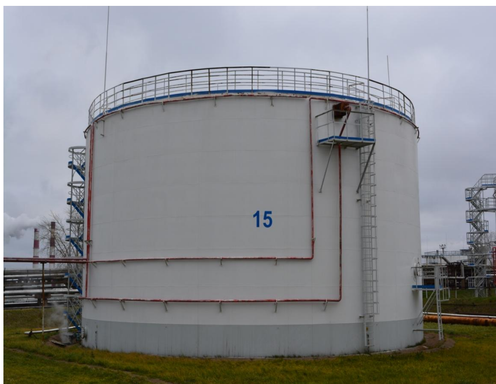
Рисунок 5 - Общий вид резервуара РВСП-5000 № 15