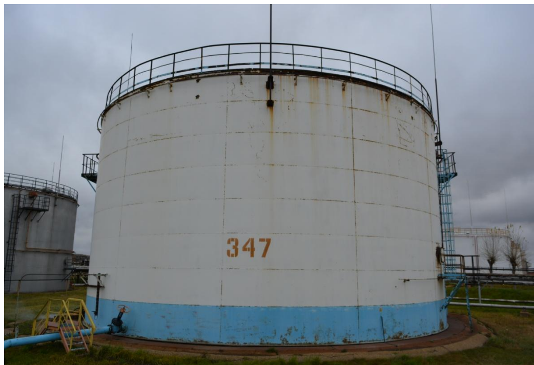
Рисунок 6 - Общий вид резервуара РВСП-5000 № 347