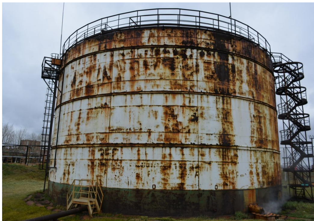
Рисунок 8 - Общий вид резервуара РВСП-5000 № 356