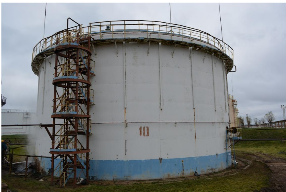
Рисунок 1 - Общий вид резервуара РВСП-5000 № 10

Общий вид резервуаров стальных вертикальных цилиндрических РВСП-5000 №№ 10, 11, 13, 14, 15, 347, 355, 356, 357 представлен на рисунках 1-9.