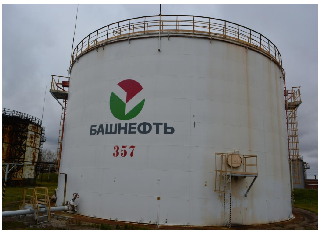
Рисунок 9 - Общий вид резервуара РВСП-5000 № 357

Пломбирование резервуаров стальных вертикальных цилиндрических РВСП-5000 не предусмотрено.