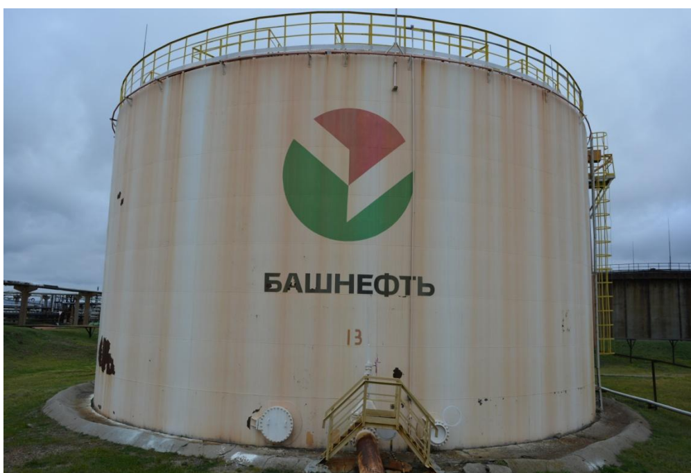
Рисунок 3 - Общий вид резервуара РВСП-5000 № 13