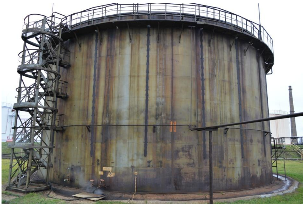
Рисунок 2 - Общий вид резервуара РВСП-5000 № 11