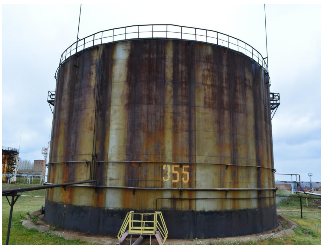
Рисунок 7 - Общий вид резервуара РВСП-5000 № 355