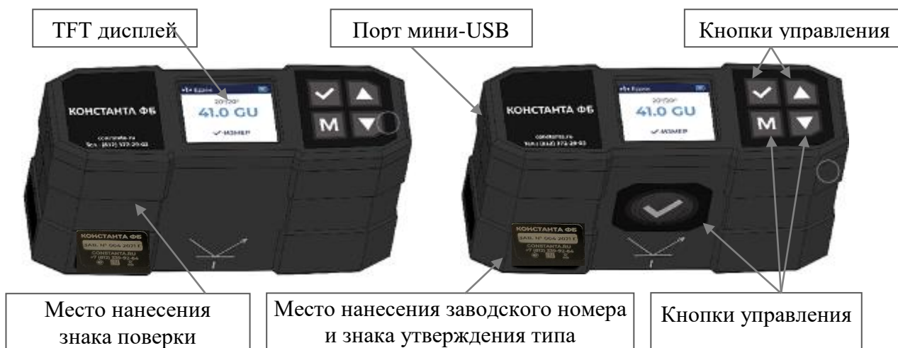
Рисунок 1 – Общий вид приборов для измерения блеска и коэффициента яркости Константа ФБ

Заводской (серийный) номер нанесен методом наклеивания на боковую панель приборов. Номер состоит из цифр длиной от трех до пяти символов.