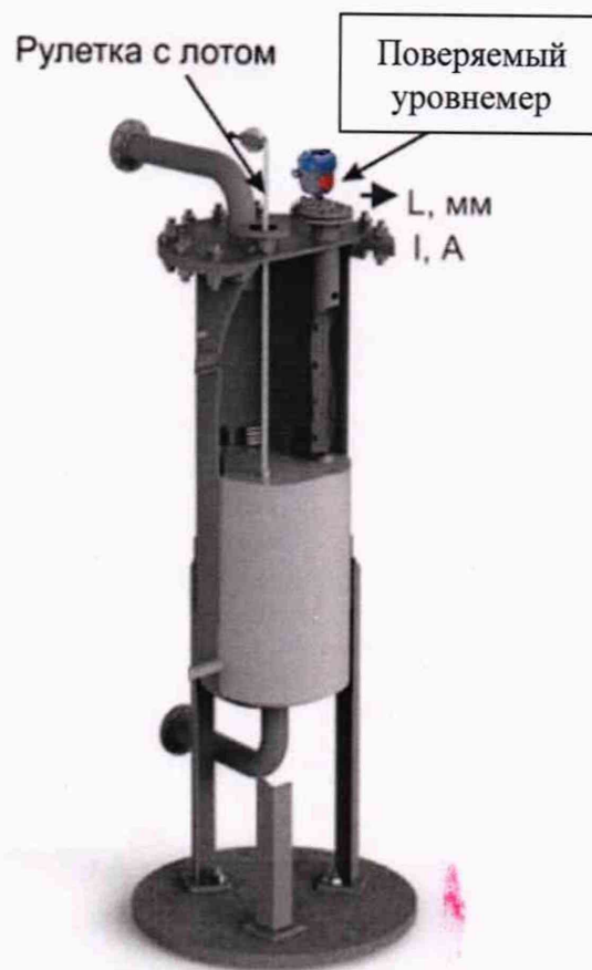
Рисунок 3 - Проверка уровнемера без демонтажа по месту эксплуатации