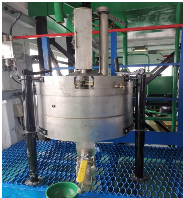
Рисунок 1 – Общий вид мерника