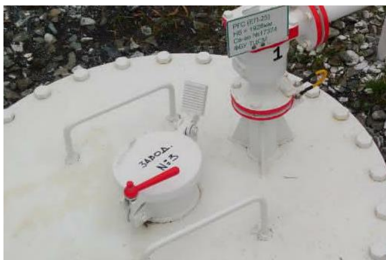
Рисунок 1 – Место нанесения заводского номера

Нанесение знака поверки на средство измерений не предусмотрено.