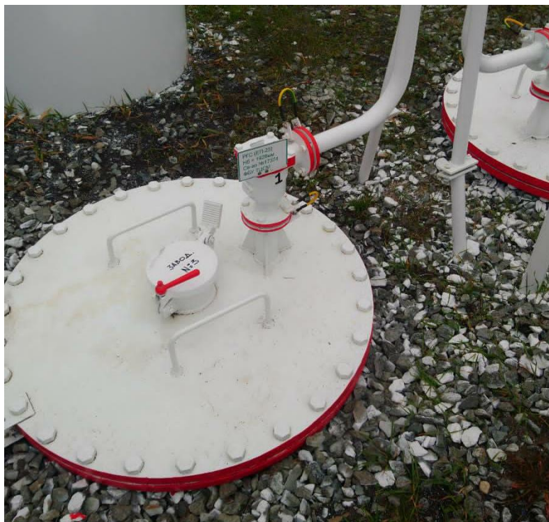
Рисунок 2 – Общий вид резервуара ЕП-25