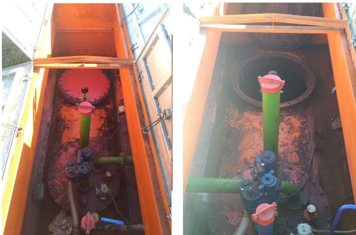
Рисунок 3 – Общий вид резервуаров Р-25

Пломбирование резервуаров Р-25 не предусмотрено.