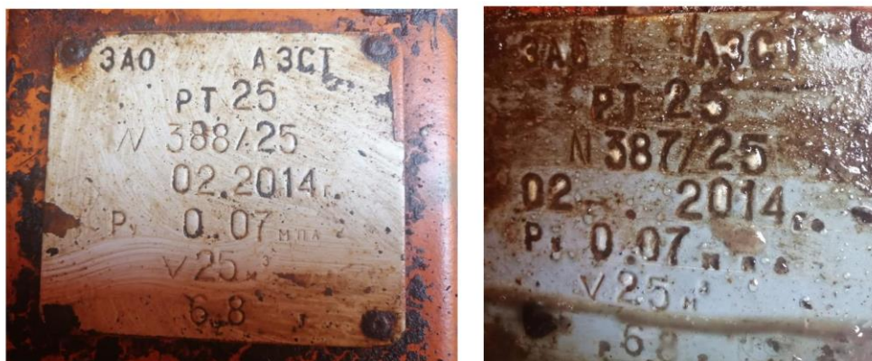
Рисунок 1 – Место нанесения заводских номеров

Нанесение знака поверки на средство измерений не предусмотрено.