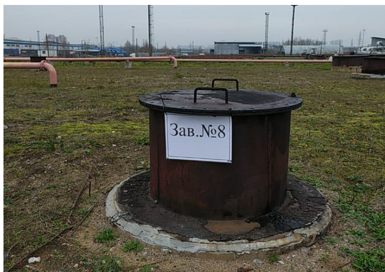
Рисунок 1 – Место нанесения заводского номера

Нанесение знака поверки на средство измерений не предусмотрено.