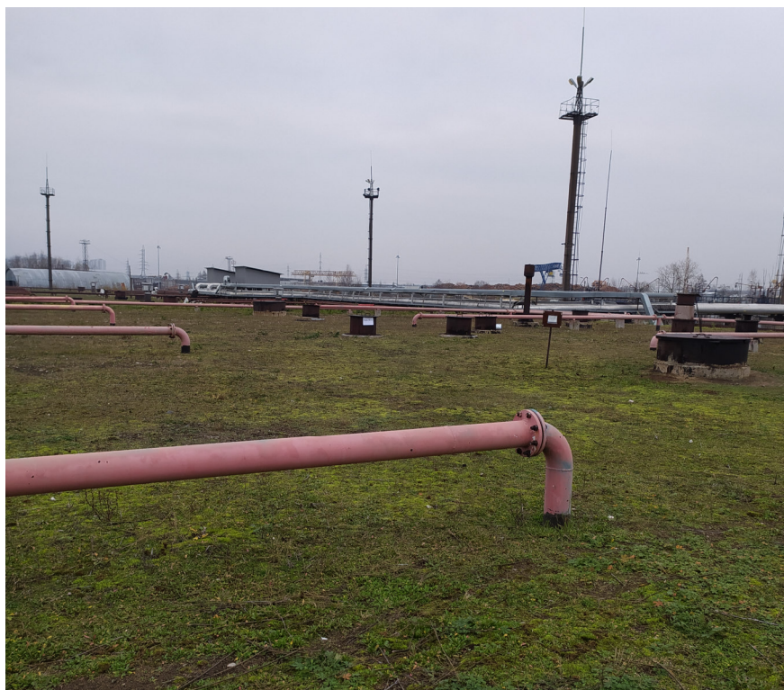
Рисунок 2 – Общий вид резервуара ЖБР-10000