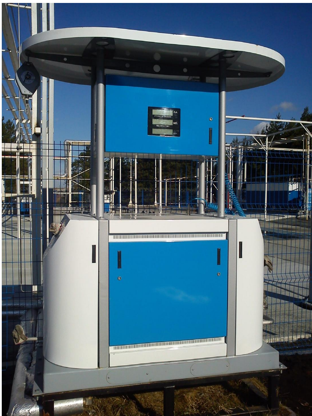
Рисунок 1 – Общий вид колонки заправочной сжиженного природного газа LNG Dispenser

В колонке пломбируется крепежный винт крышка электронно-вычислительного устройства и фиксирующая крышка расходомера, место присоединения расходомера к подводящему патрубку. Схема пломбировки от несанкционированного доступа, обозначение места нанесения знака поверки представлены на рисунке 2.