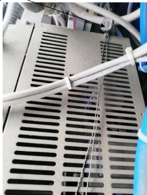
Рисунок 2 – Место пломбировки от несанкционированного доступа, обозначение мест нанесения знака поверки и пломб завода-изготовителя, на: модуль индикации Esiwelma, расходомер-счётчик массовый Micro Motion CMF 100