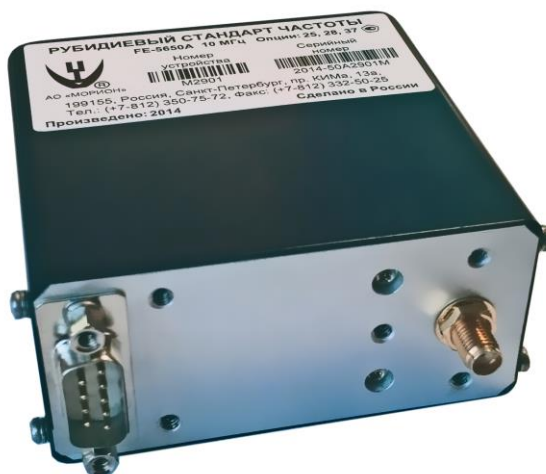
Рисунок 1 – Общий вид СЧ

Схема пломбировки от несанкционированного доступа, обозначение мест нанесения знака поверки представлены на рисунке 2.