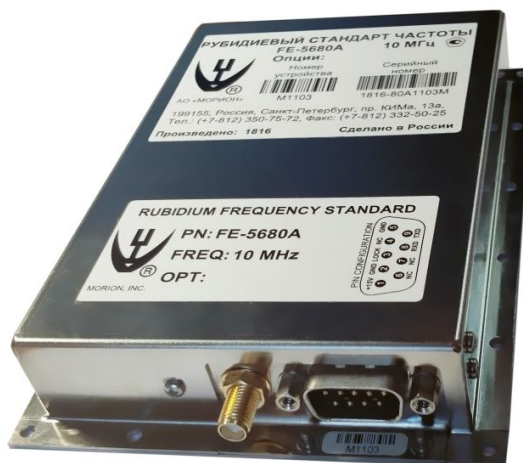
Рисунок 1 – Общий вид СЧ

Схема пломбировки от несанкционированного доступа, обозначение мест нанесения знака поверки представлены на рисунке 2.