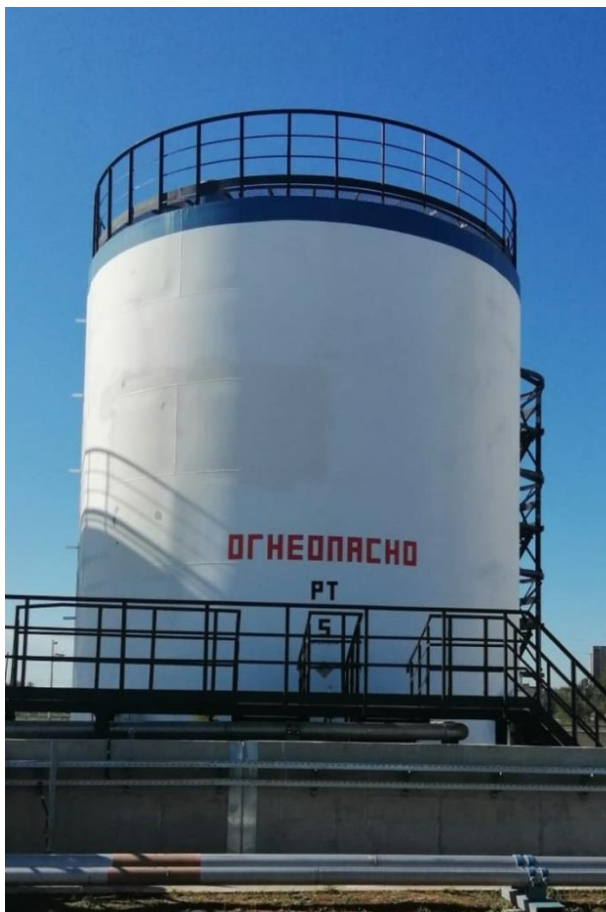
Рисунок 1 – Общий вид резервуаров РВС-514