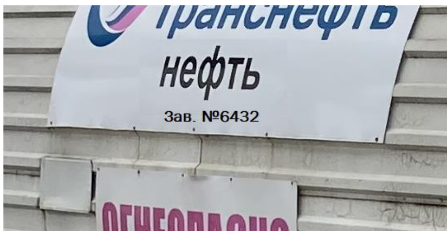
Рисунок 1 – Место нанесения заводских номеров

Нанесение знака поверки на средство измерений не предусмотрено.