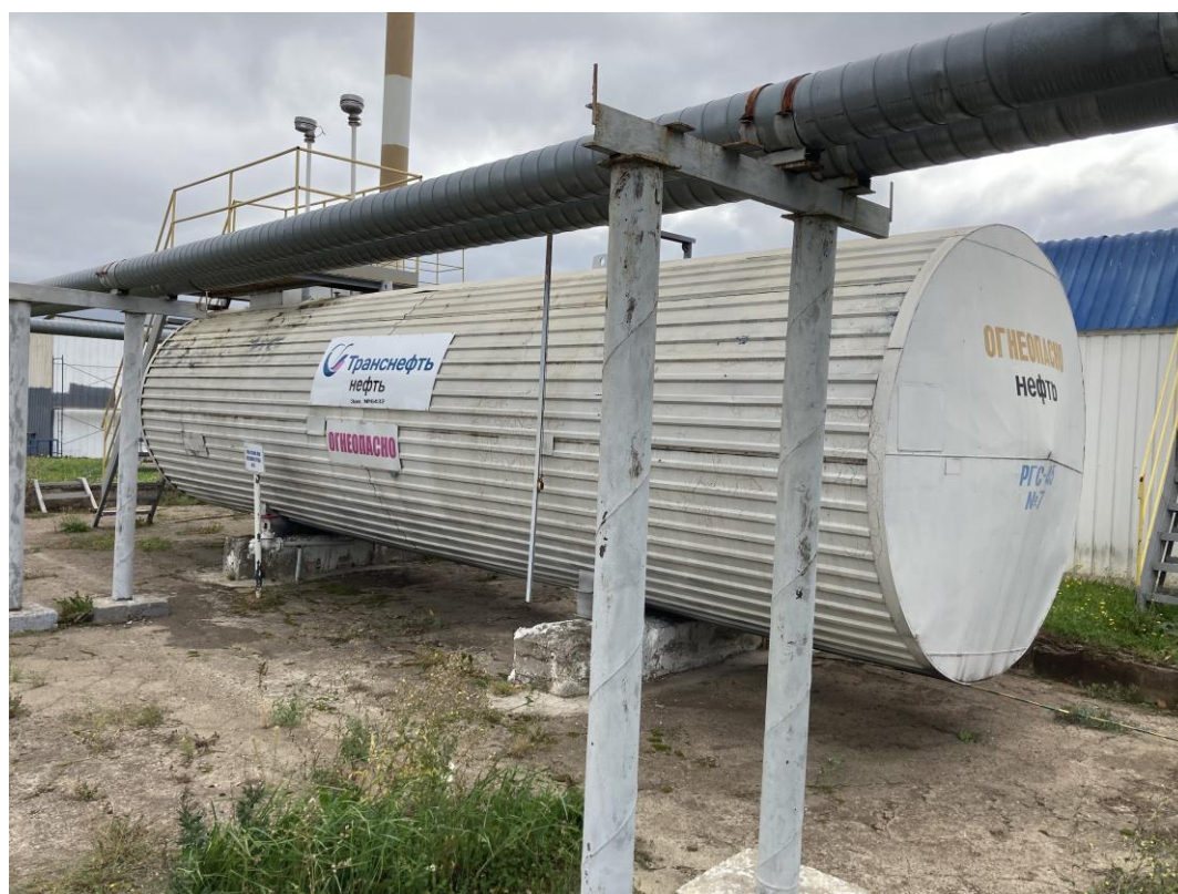
Рисунок 3 – Общий вид резервуара РГС-50

Пломбирование резервуара РГС-50 не предусмотрено.