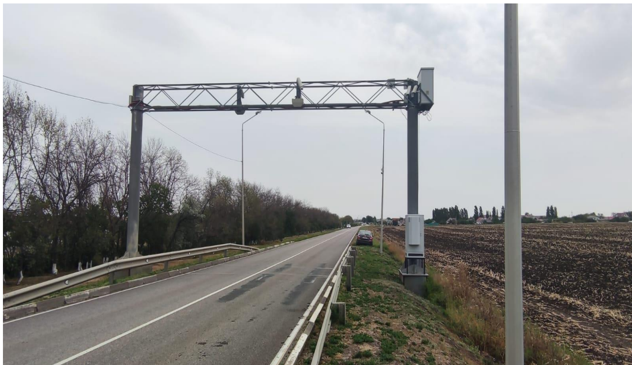
Рисунок 1 – Общий вид систем «ФОРТИС»

Схема пломбировки от несанкционированного доступа представлена на рисунке 2.