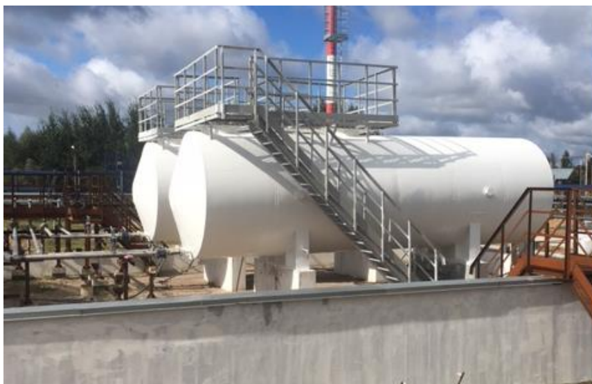
Рисунок 1 – Общий вид резервуаров РГС-50

Общий вид резервуаров горизонтальных стальных цилиндрических РГС-50 зав.№№ 211/1, 211/2 представлены на рисунках 1-5.