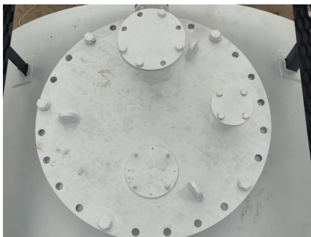
Рисунок 5 – Общий вид резервуаров РГС-50

Пломбирование резервуаров горизонтальных стальных цилиндрических РГС-50 не предусмотрено.