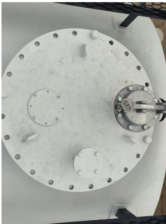
Рисунок 4 – Общий вид резервуаров РГС-50