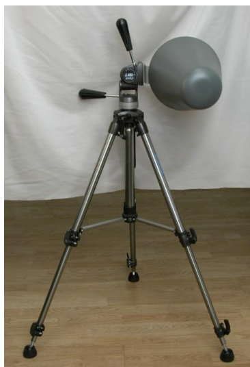
Рисунок 1 – Общий вид антенны ЕЛВ-26

Схема пломбирования от несанкционированного доступа приведена на рисунке 2.