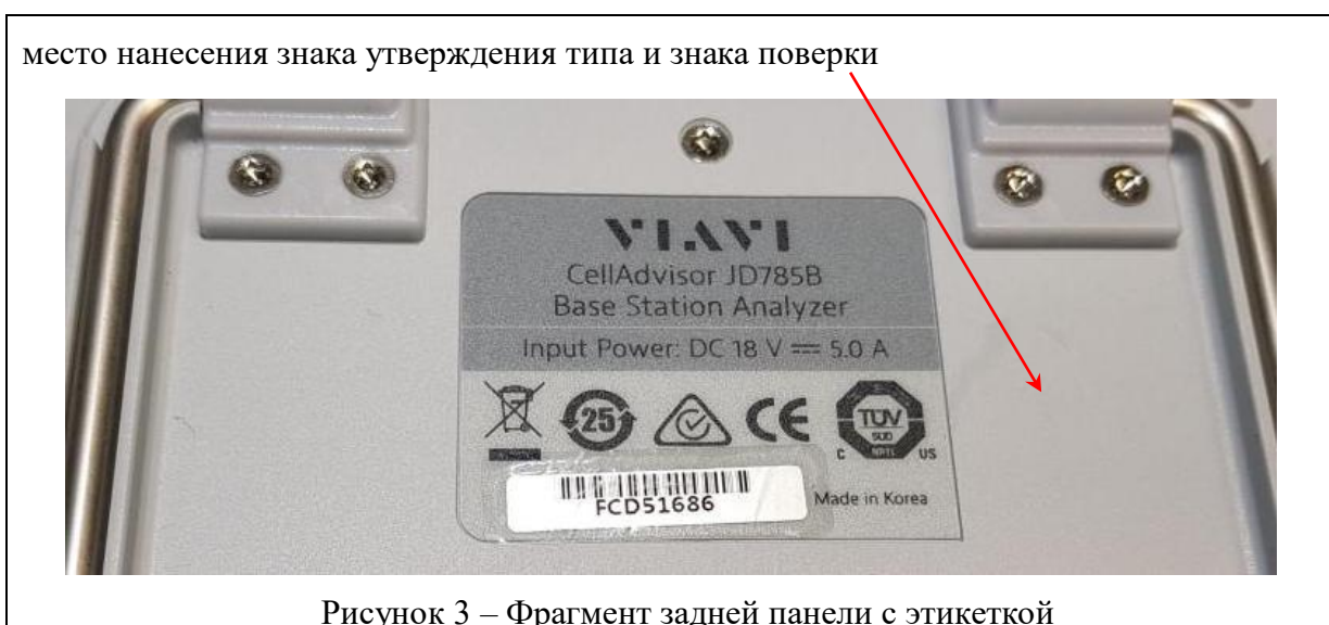
Рисунок 3 – Фрагмент задней панели с этикеткой

Самоклеющаяся этикетка с заводским (серийным номером), однозначно идентифицирующим каждый экземпляр анализаторов, находится на задней панели, фрагмент которой с указанием места нанесения знака утверждения типа и знака поверки в виде самоклеющихся этикеток показан на рисунке 3.