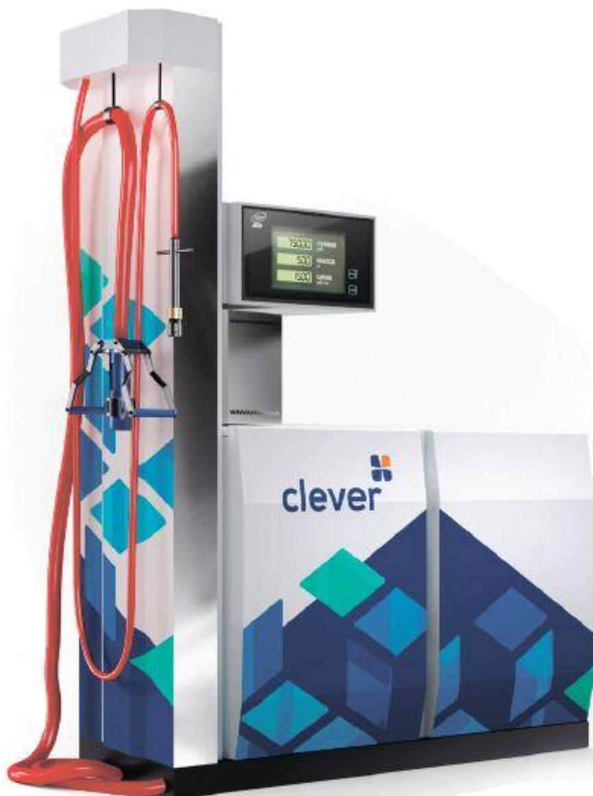
Рисунок 1 – Общий вид колонки