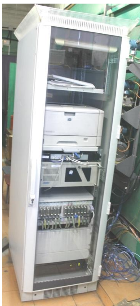
Рисунок 2 – Общий вид приборной стойки