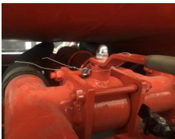
Рисунок 5 – Кран шаровый на трубопроводе