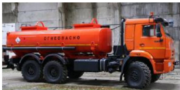
Рисунок 1 Общий вид АТЗ с двумя секциями

Общий вид АТЗ и АЦ представлен на рисунке 1, 2. Место пломбирования от несанкционированного доступа обозначено на рисунке 3,4,5.