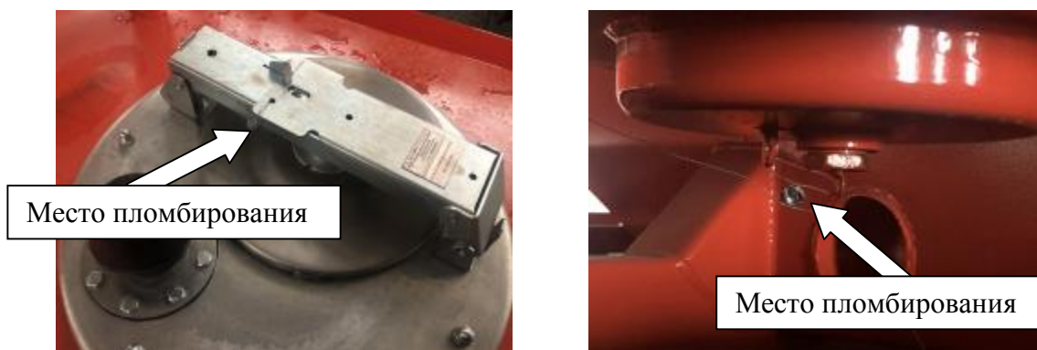
Рисунок 3 – Запорный механизм крышки заливной горловины и кран сливной отстойника