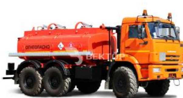
Рисунок 2 Общий вид АЦ с тремя секциями