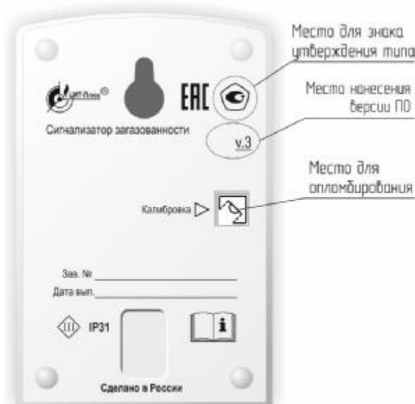
Рисунок 3 – Схема пломбировки от несанкционированного доступа и место нанесения знака утверждения типа