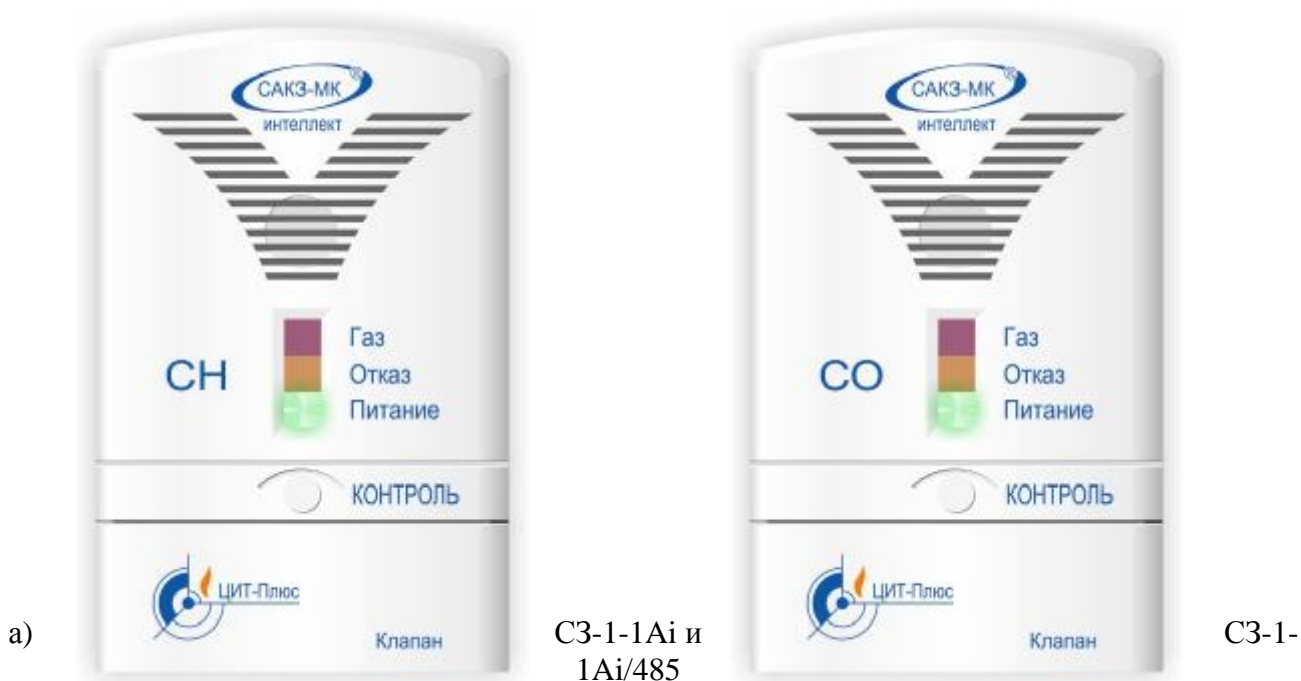
б) C3-2-2Ai и C3-2-2Ai/485