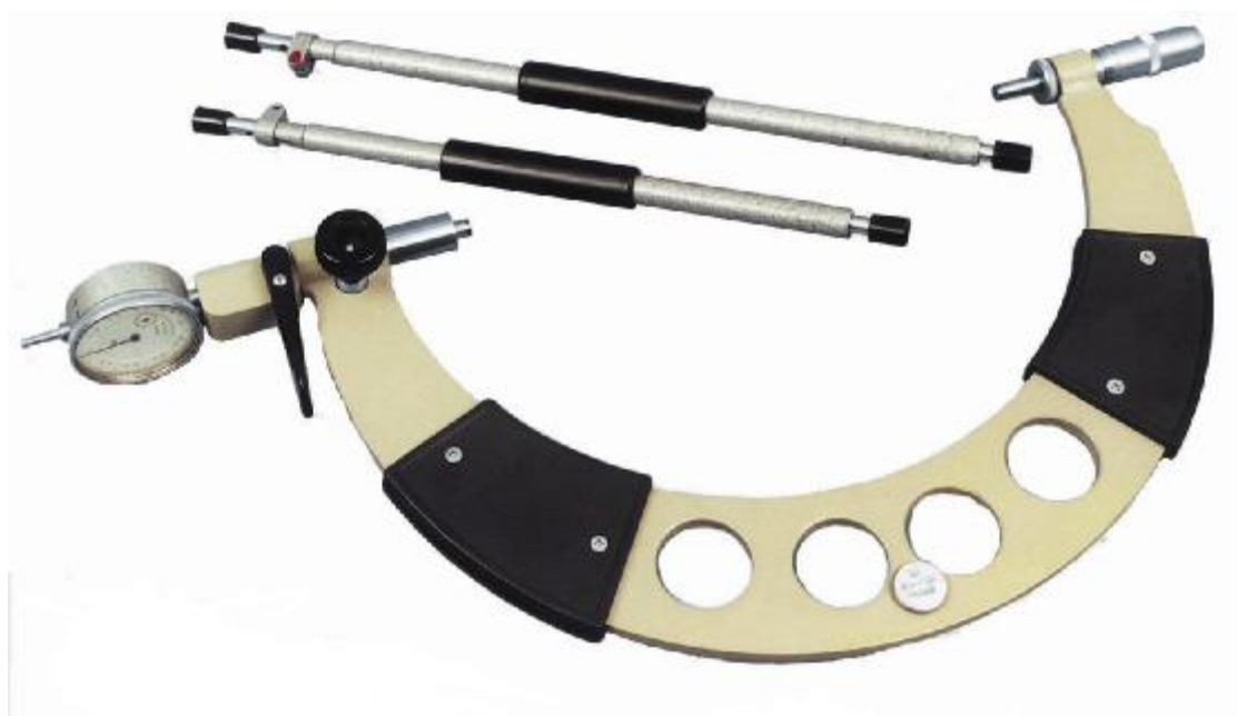
Рисунок 1 - Общий вид микрометров рычажных МРИ

Микрометры рычажные выпускаются в 7 модификациях – МРИ 400, МРИ 500, МРИ 600, МРИ 700, МРИ 800, МРИ 900, МРИ 1000, которые отличаются друг от друга диапазонами измерений, нормируемой погрешностью, габаритными размерами и массой.