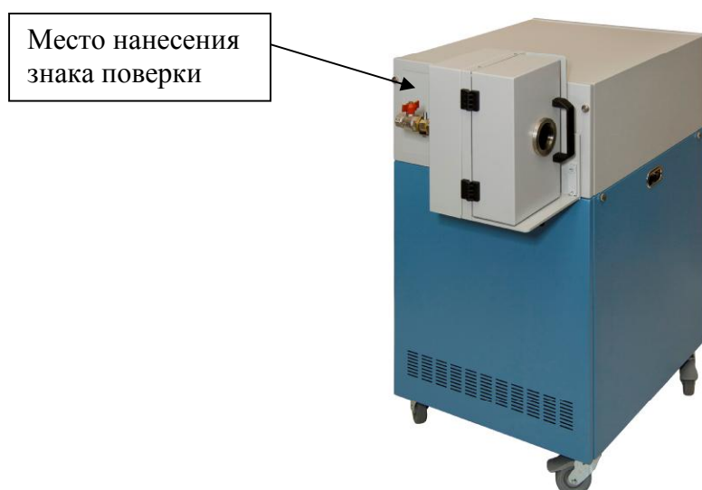
Рисунок 1 – Общий вид спектрометра МФС-11

Общий вид спектрометра МФС-11 и место нанесения знака поверки представлены на рисунке 1.