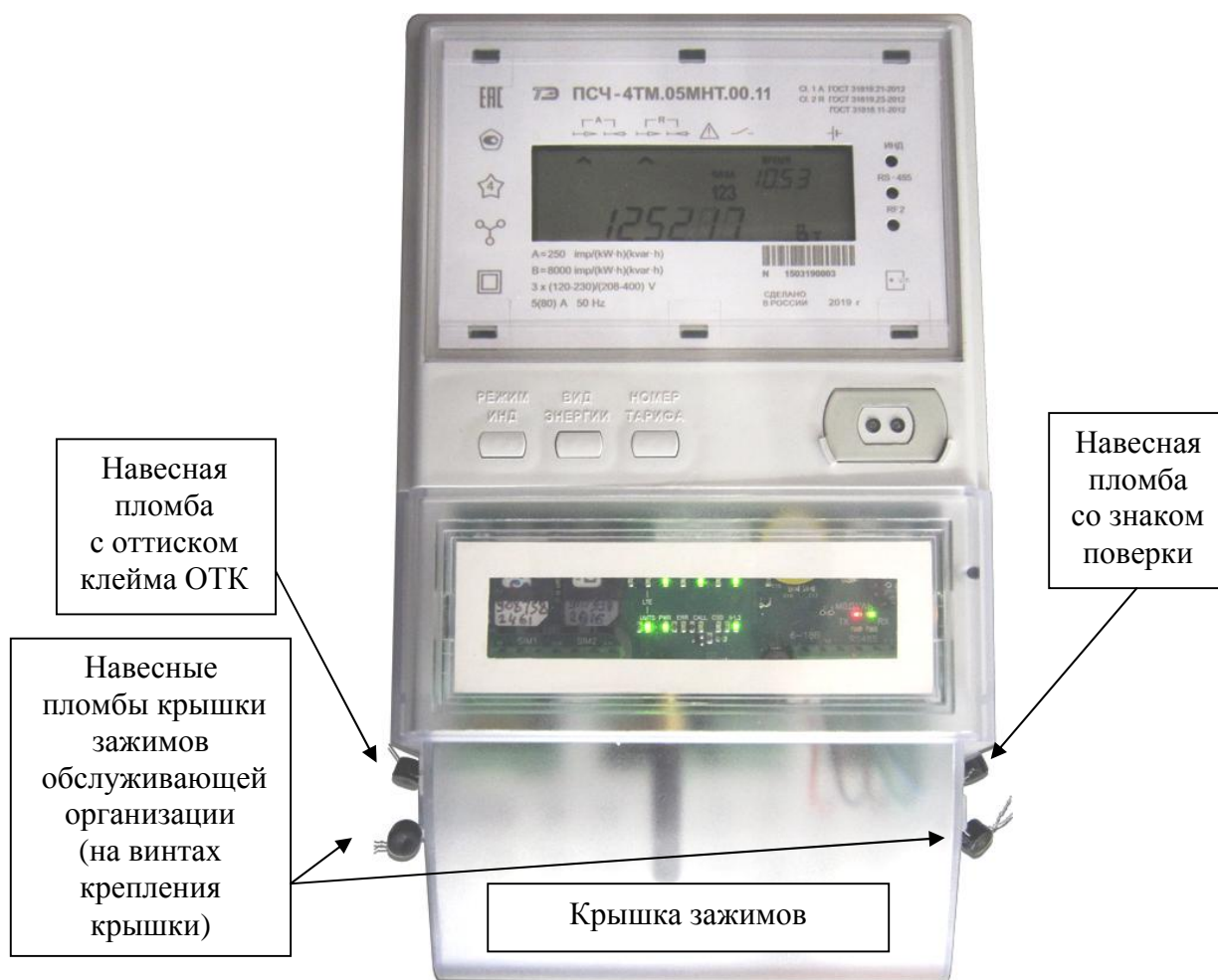
Рисунок 2 – Общий вид счетчика внутренней установки с установленной крышкой зажимов, схема пломбировки и обозначение места нанесения знака поверки